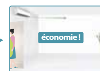
Passage en mode éco