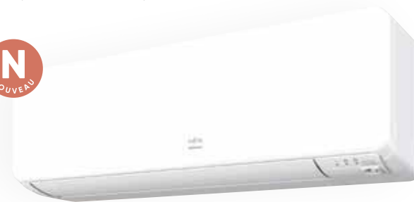
VERSION CHAUD SEUL SELON MODÈLE