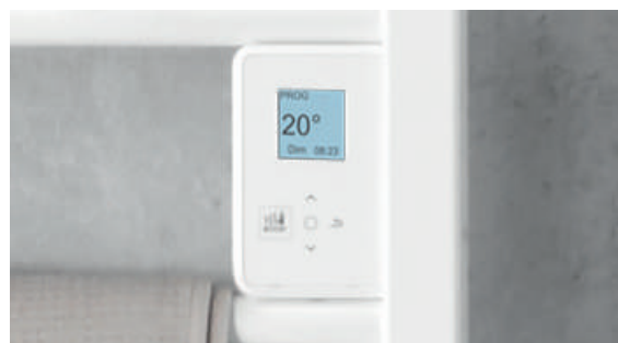
Boîtier digital tactile et programmable