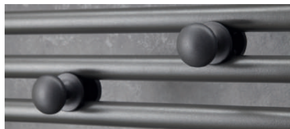
2 patères boutons amovibles