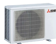
MUZ-AY 25/35/42 VG