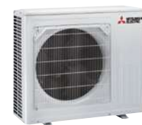
MUZ-AY 50 VG