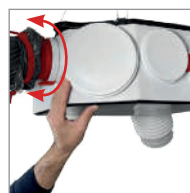
Octeo PowerTwist® 360° de possibilités Adaptable et compact

Existe en versions détection d'humidité (DHU) et contrôle de la Qualité d'Air Intérieur (SERENITE)