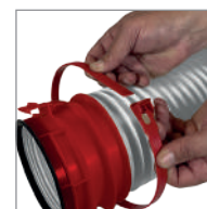
Octeo PowerFix® Raccordements simplifiés et ultras résistants