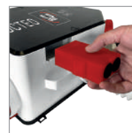
Octeo PowerConnect® Plug&Play - Etanchéité et connectivité jamais égalées