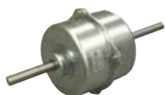
Pression statique de 0 à 90 Pa

Grâce au moteurs de ventilation DC Inverter, la pression statique est réglable de 0 à 90 Pa, directement depuis la télécommande.