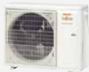
AOYG 18 KBTB