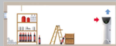
Stable sans gaine

→ AIR AMBIANT Aspiration et refoulement de l'air dans la pièce