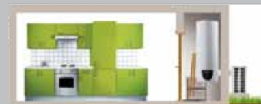
Split vertical mural

→ A PROXIMITÉ D'UNE PIÈCE DE VIE • Aspiration et refoulement de l'air à l'extérieur • Installation dans un placard