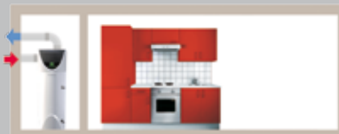
Stable avec gaine

→ AIR EXTÉRIEUR Aspiration et refoulement de l'air à l'extérieur