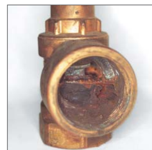
Tubes et vannes obstrués par un dépôt de particules