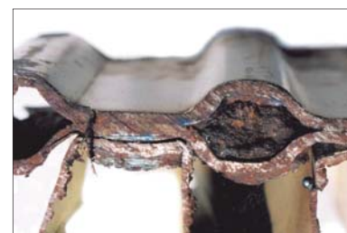
Radiateur bouché par la présence d'impuretés

Fait N°11 Du fait de la corrosion et de l'encrassement des tuyaux, la consommation électrique des pompes augmente jusqu'à 35% au cours des premières années de fonctionnement des installations de chauffage ou de refroidissement.