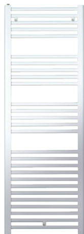
Raccords sur les collecteurs